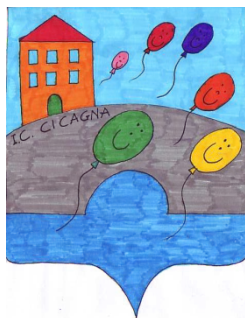
Scuola secondaria di 1° grado